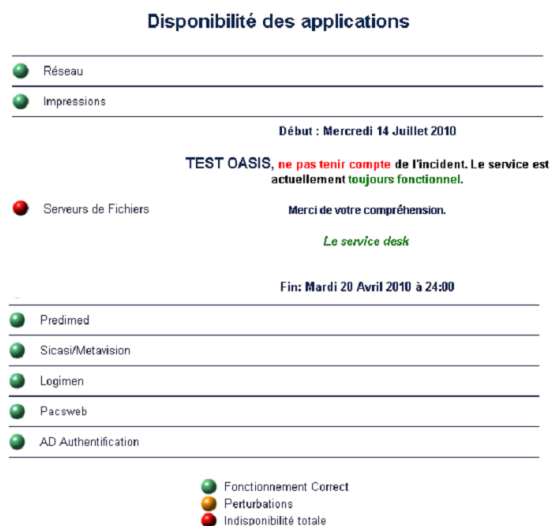
Fig. 1 : Page Intranet du CHUV (Disponibilité des applications)

Pour pallier à ce problème, le projet OASIS (Outil d'Aide au Support, Intégré au Système) a pour but d'automatiser entièrement le dit processus, de l'ouverture d'un incident, jusqu'à sa fermeture.